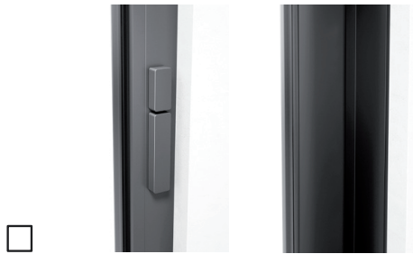
Ohne Profilzylinder, Drehknopf innen, Schiebegriff innen, ohne Muschelgriff außen