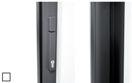
Mit Profilzylinder, Drehknopf innen, Schiebegriff innen, ohne Muschelgriff außen