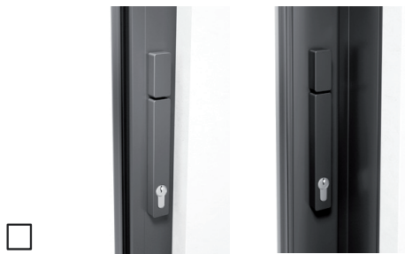
Mit Profilzylinder (Voll-PZ), Drehknopf innen + außen, Schiebegriff innen + außen