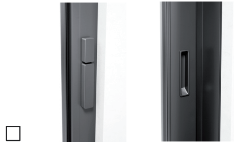
Ohne Profilzylinder, Drehknopf innen, Schiebegriff innen, mit Muschelgriff außen