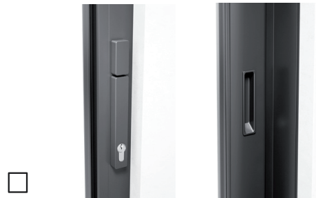
Mit Profilzylinder, Drehknopf innen, Schiebegriff innen, mit Muschelgriff außen